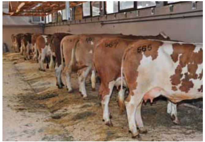
Tierschauen oder ähnliche Veranstaltungen, bei denen eigene Tiere mit fremden Tieren oder Personen in Kontakt kommen, stellen ein Gesundheitsrisiko dar (Quelle: agrarfoto.com).

Laut BVD-Verordnung muss jedes Rind beim innerstaatlichen Transport von einer Gesundheitsbescheinigung begleitet werden, die vom Empfänger der Tiere mindestens fünf Jahre aufzubewahren und der Behörde auf Verlangen zur Kontrolle vorzulegen ist. Die Ausstellung der Gesundheitsbescheinigung obliegt grundsätzlich dem Amtstierarzt beziehungsweise den vom Landeshauptmann beauftragten Stellen.