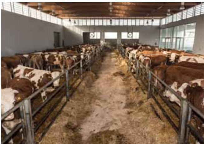
Quarantänemaßnahmen im Ausmaß von mindestens 3 Wochen (besser 6 Wochen) dienen dazu, die eigene Herde vor möglichen Infektionen durch die zugekauften Tiere zu schützen.

In der Quarantäne können Tiere auf erkennbare Atemwegs-, Darm-, Haut- oder Eutererkrankungen untersucht werden. Labordiagnostische Maßnahmen können einen festgelegten Gesundheitsstatus (z.B. Freiheit von Paratuberkulose, Staphylokokkus aureus) absichern.