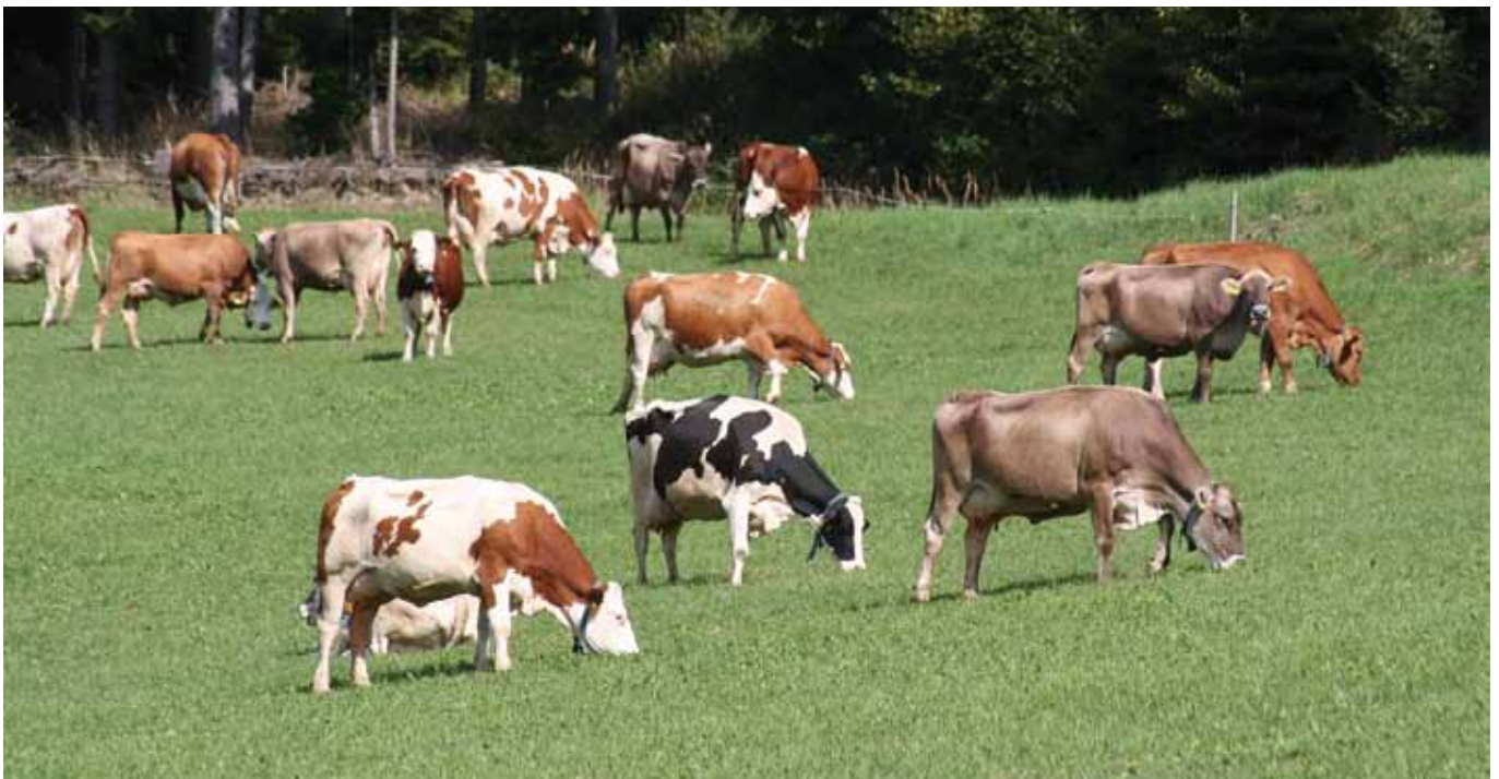
Biosicherheitsmaßnahmen sollen dazu beitragen, die eigene Herde bestmöglich gegen Krankheiten zu schützen (Quelle: Kalcher).

Interne Biosicherheit umfasst Maßnahmen, die die Ausbreitung von Krankheiten innerhalb landwirtschaftlicher Betriebe bekämpfen (Quelle: Universität Gent, www.biocheck.ugent.be ).