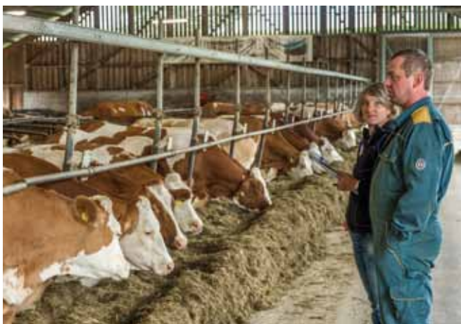
Die regelmäßige Tierbeobachtung und Tierkontrolle tragen zur Aufrechterhaltung der Tiergesundheit bei und ermöglicht die Früherkennung von Krankheitsanzeichen.

Regelmäßige Tierbeobachtung und Tierkontrolle tragen zur Aufrechterhaltung der Tiergesundheit bei und ermöglichen die Früherkennung von Krankheitsanzeichen. Eine tägliche Beobachtung der