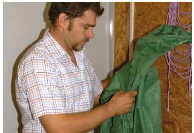
Im Quarantänebereich sind eigene Bekleidung, Stiefel und Gerätschaften zu verwenden, die nicht gleichzeitig bei der bestehenden Herde verwendet werden dürfen.