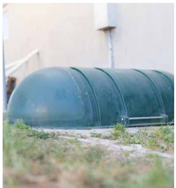
Die Tierkörper auf befestigtem Boden oder Plane und mit einer Abdeckung lagern.