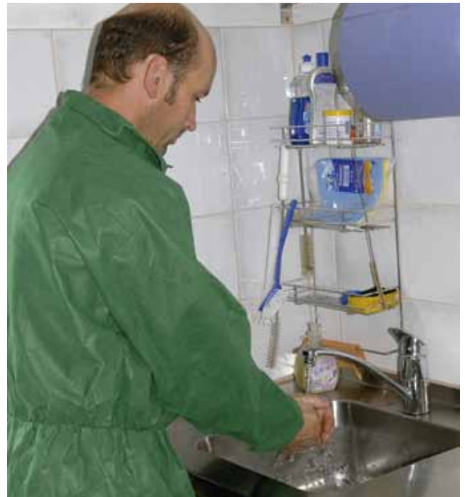
Das Tragen sauberer Arbeitskleidung sowie das regelmäßige Waschen der Hände, am besten auch mit anschließender Desinfektion, ist empfohlen.

Schutz vor Ein- und Ausschleppung von Erregern ihre Hände, Stiefel und ihr Werkzeug gründlich reinigen.