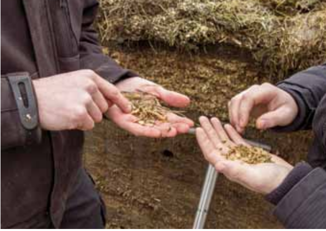
Die Qualität der Futtermittel sollte immer wieder mit einer Sinnenprüfung und durch Futtermitteluntersuchungen überprüft werden.

Kalb statt. Infektionsquellen für Rinder aber auch für Schafe und Ziegen sind Futtermittelverschmutzungen durch Hundekot. Vor allem Hofhunde sind in diesem Zusammenhang als Risikofaktoren zu sehen, da sie häufiger in Kontakt mit infiziertem Material (Nachgeburt, rohes Fleisch) kommen können. Haushunde („Stadthunde“) haben in den seltensten Fällen Gelegenheit, infiziertes Material aufzunehmen und sind deshalb einem geringeren Infektionsrisiko ausgesetzt. Eine regelmäßige Entwurmung des eigenen Hofhundes ist eine wichtige Maßnahme, um hofinterne Infektionsketten zu unterbrechen!