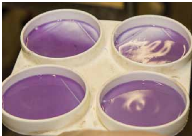
Der Hygiene im Melkstand bzw. der Eutergesundheit ist große Beachtung zu schenken.

der Geburtsregion des Tieres sowie von Händen und Armen. Das Tragen sauberer Kleidung (Geburtskittel) und die Verwendung von gereinigten und desinfizierten Stricken wird empfohlen.