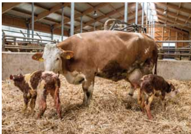
Die Abkalbebox ist möglichst sauber und trocken zu halten, die Einstreu wird regelmäßig gewechselt und erneuert.

Der Abkalbbereich ist möglichst sauber und trocken zu halten, die Einstreu wird regelmäßig gewechselt und erneuert. Bei der Gestaltung des Bereiches sollte auch an die Möglichkeit einer einfachen und gründlichen Reinigung und Desinfektion gedacht werden, welche dann bei entsprechenden Leerzeiten der Abteile zu erfolgen hat. Außerdem soll der Abkalbbereich eine intensive Tierbeobachtung ermöglichen. Bei der Geburtshilfe ist auf äußerste Hygiene zu achten. Dazu gehört eine gründliche Reinigung