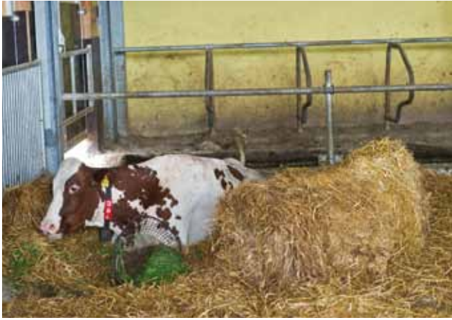
Für kranke Tiere müssen in ausreichendem Ausmaß Absonderungsbuchten zur Verfügung stehen (Quelle: agrarfoto.com).

Gemäß 1. Tierhaltungsverordnung müssen für kalbende oder kranke Tiere in Gruppenhaltungen in ausreichendem Ausmaß Absonderungsbuchten zur Verfügung stehen. Absonderungsbuchten bei Kälbern benötigen keinen direkten Sicht- und Berührungskontakt mit Artgenossen.