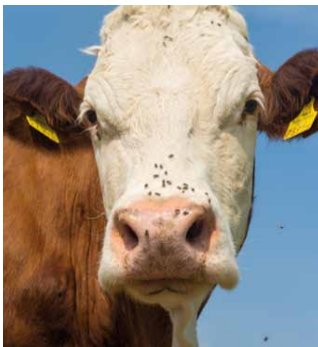
Insekten können Infektionen wie das Blauzungen- oder Schmallenbergvirus übertragen.

Umfangreiche Broschüren, die auch das Thema Tiergesundheit bei der Alpung behandeln, werden vom Verein Almwirtschaft Österreich bzw. LFI Österreich herausgegeben.