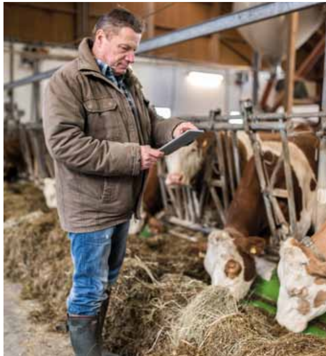
Die Erfassung und Auswertung von Produktions- und Managementdaten (z.B. aus dem Tagesbericht) lassen Rückschlüsse auf die Tiergesundheit zu.

verschiedenen Tiergruppen (Kälber, frisch abgekalbte Kühe, gesundheitlich auffällige Tiere usw.) mit entsprechender Dokumentation ist ratsam. Der Betrieb soll außerdem einer regelmäßigen tierärztlichen Betreuung mit entsprechender Gesundheitsberatung unterliegen. Bei Verdacht auf eine vorliegende Infektionskrankheit oder meldepflichtige Erkrankung ist umgehend der Tierarzt oder die Tierärztin zu kontaktieren bzw. Meldung bei der zuständigen Stelle zu erstatten.