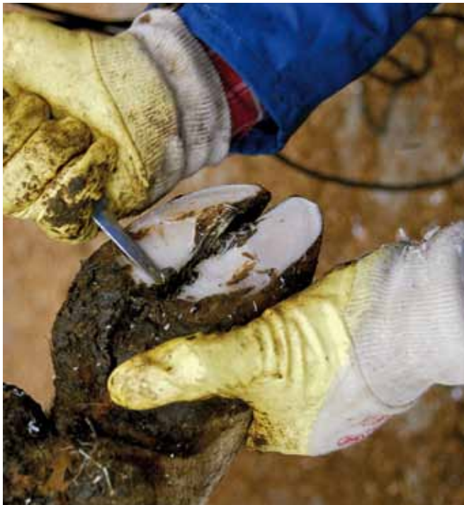
Werkzeuge, z.B. solche zur Klauenpflege, sind regelmäßig zu reinigen und zu desinfizieren.